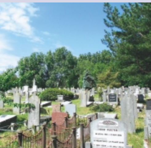
Een andere vraag is: 'Zijn alle grafmonumenten stuk voor stuk beschermd?' Nee, meestal niet stuk voor stuk, maar wel het beeld dat ze samen opleveren. Algemene Begraafplaats in Den Helder